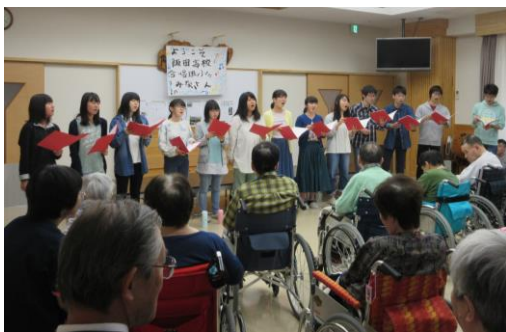
美しい歌声が園内に響き渡りました。

り表情が変わらないの目を大きく見開き歌に聴き入っている方、歌に合わせて手をひらひらと振る方など、いつもは見られない利用者さんの姿を見ることができ、職員も嬉しかったです。合唱班の皆さんのおかげで素敵な時間を過ごすことが出来ました。来年も素晴