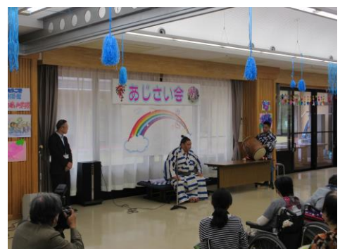
質問にも優しく答えて下さいました。