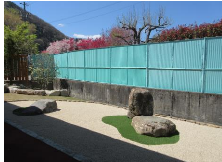
風情のある庭で園内の隠れた名所となっています。

た。また、居室テラス側に、坪庭を作りました。お金もかけられなかったので立派なものではありませんが、居室の軒に燕が巣を作り、雨上がりの庭はそれなりの風情があります。また、南棟のテラスにもガードパイプ柵を設置し、電動車椅子使用の利用者の方が、安全にテラスでくつろ