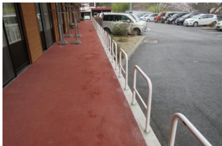
ガードパイプ柵を設置し安全に過ごせるようになりました。

福祉車両は現在二台使っていますが、ショート利用者の送迎には狭く急峻な地域の実情を考えると、軽自動車の福祉車両を一台確保する必要があると判断し購入しました。これで福祉車両は三台となり、緊急避難の場合は一度に五名の方の搬送ができ、防災対策としても機能するのではないかと思います。また、プリウスPHVを購入し、省エネ及び非常用バッテリーとしても利