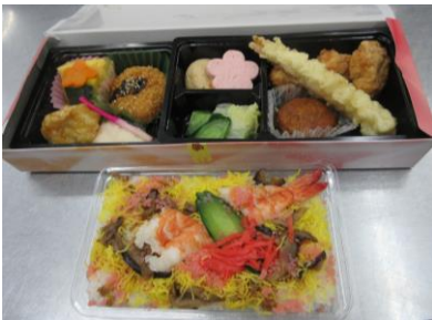
行事の時はいつもと違った食事で、毎回楽しみにしています。

第三部の昼食会は、 利用者と保護者が一緒 の席にてちらし寿司と 折詰やセルフサービスの 飲み物、果物、デザ ートを交流しながら楽 しんでいました。