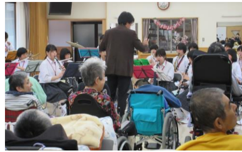
歌あり、踊りありの楽しいステージを披露して下さいました。

四月二十二日、阿智中学校吹奏楽部の皆さんを招いて演奏会を行いました。流行の曲から時代劇のあの曲まで、楽しいステージを披露して下さいました。初々しい中学生の演奏を聴き、体でリズムをとったり涙ぐんだりする利用者さんも見