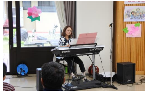
バラエティーに富んだ曲を披露してく ださり皆さん楽しんでいました。