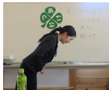
新任職員を対象にマナー研修を実施しました。

四月十三日、飯田信用金庫の方を講師にお迎えしてマナー研修が行われました。マナーとは態度やふるまい等の「形」であり、相手に思いやり・敬意といった目に見えない「心」を伝えるものという事が分かりました。また、笑顔には親しみを持ってもらえる・相手の警戒心を解く・相手のやる気を起こすという効果があるとの事です。利用者・職員が共に笑顔溢れる施設にしたいと思いました。研修し