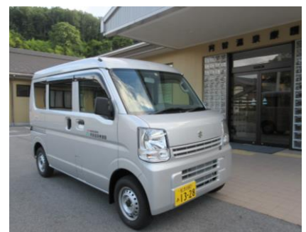
小回りが利くので狭く急な道でも送迎が容易にできます。