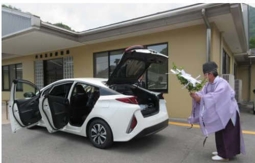
災害時の非常用バッテリーとして活躍が期待されます。