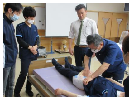
実際にオムツを当ててみて感触を確かめました。

四月から入職し慣れてきた頃オムツ研修を受けました。基本の紙オムツや布オムツの当て方を教えて頂き、実際にオムツを当てました。当て方によって気持ち悪いと感じる事があり、体験して実感しました。研修から学んだことを活かして利用者さんの生活の一部である排泄介助をしていきたいです。(Y・U)