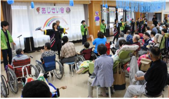
迫力のある踊りを披露して下さいました。

第一部は阿南町を中 心にご活躍されている 南舞舞姫の皆さんのソ ーラン踊り。二曲目で は、保護者会長様、職 員も一緒に踊りに参加 させて頂き、楽しいひ