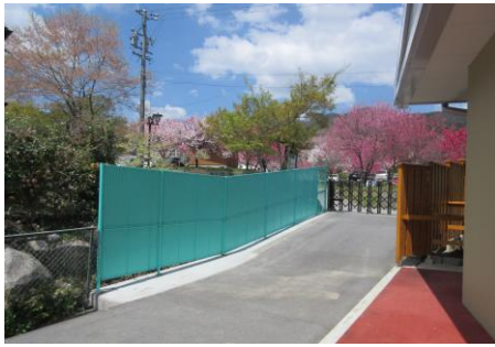
防犯対策設備整備事業の補助を受けてフェンスを整備しました。

防犯対策設備整備事業の補助を受けてフェンスを整備しました。施設裏手、隣地境のフェンスは、丈も低く汚損も進んでいたため、丈の高いものに更新しました。裏手入り口通路側には、昨年、居室のプライバシーに配慮し坂塀を設置していたので、少し重厚な感じがする裏口になりました。